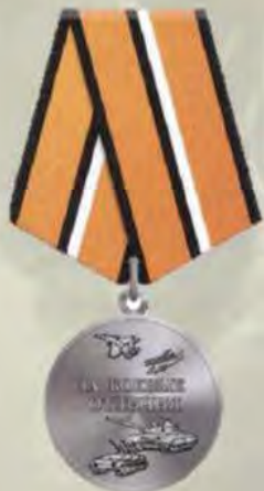
МЕДАЛЬ "ЗА УКРЕПЛЕНИЕ БОЕВОГО СОДРУЖЕСТВА"